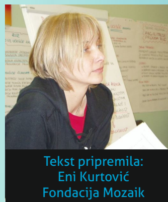
Tekst pripremila: Eni Kurtović Fondacija Mozaik

Nadamo se da će ovo što smo naučili kroz provođenje projekta “Za aktivne mjesne zajednice” dati ideju i podsticaj čitateljima da provedu slične aktivnosti u svojim zajednicama. Želimo vam uspjeh u vašim nastojanjima da se žene i mladi više uključe u rad savjeta MZ!