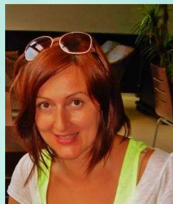
Tekst pripremila: Valentina Gagić, UG Sara Srebrenica

S obzirom da se čini kako u izmjenama federalnog Zakona, kao ni u prijedlogu izmjena Zakona o lokalnoj samoupravi u RS, neće biti ugrađeni mehanizmi za osiguravanje učešća žena i mladih, jedan od načina da se ovo učešće osigura i u Federaciji bi moglo biti usvajanje dokumenta sličnog pomenutom Uputstvu, koje je već usvojeno u RS. Ono što nam predstoji, jeste da nastavimo aktivno zagovarati za ovakve politike, bilo na entitetskim, ili na opštinskim nivoima. Nadamo se da ćete nam se pridružiti.