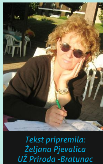
Tekst pripremila: Željana Pjevalica UŽ Priroda -Bratunac

Ne propustite priliku da birate žene za članove savjeta MZ. A ako ste žena, iskoristite mogućnost da se kandidirate i postanete članica savjeta MZ!!